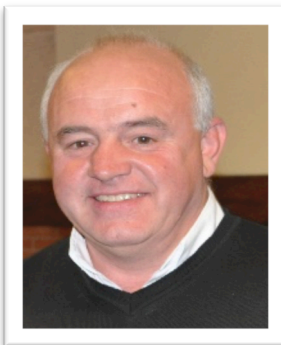
Organisation compétitions en zone Pyrénées , Interclubs, coupe de la ligue, champ. match-play