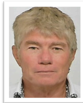
Responsable gestion & opérations de la zone Méditerranée