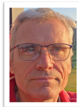
Organisation P&P en zone Méditerranée