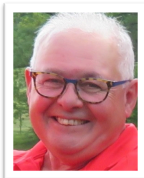
Partenariats & sponsoring